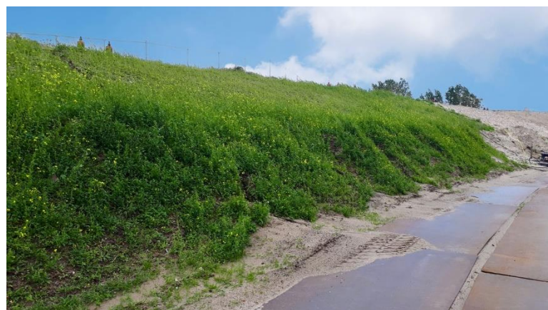
Overgang open bak naar blokkenspoor Begroeiing op aangebrachte grond ter hoogte van de tunnel

In de binnenzijde van de tunnel is verder gewerkt aan de railopstorten, de definitieve verlichting, de noodverlichting en het aanbrengen van staalprofielen in het plafond voor de bovenleiding.