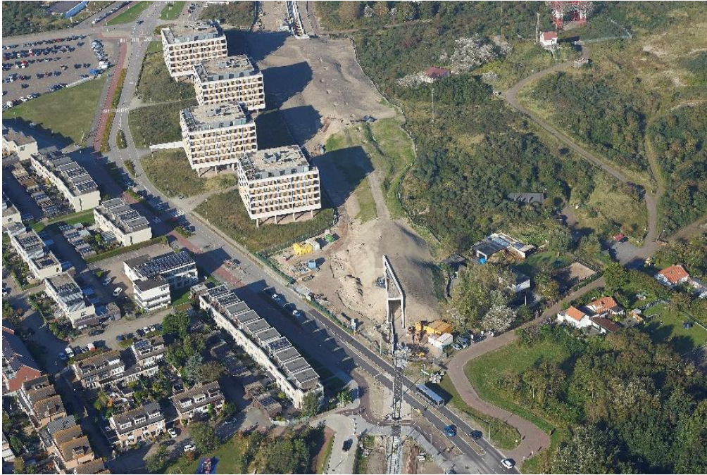
Luchtfoto spoorwegovergang Strandboulevard en tunnelentree