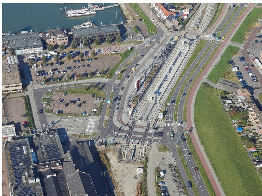
Luchtfoto huidig en nieuw Station Hoek van Holland Haven

ABS aan Zee heeft verder gewerkt aan de afronding van de bestuurdersruimte, staal, kabels, verlichting en de invulling van de technische ruimte. Alhoewel individuele tussenmijlpalen voor het afbouwen van Station Hoek van Holland Haven niet gehaald zijn, is de oplevering van het station nog op de voorziene eindmijlpaal gepland.