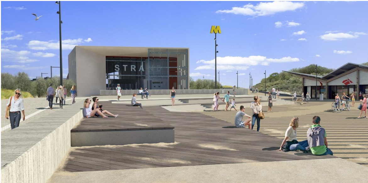
Impressie zitelementen Strandplein

De zitelementen, die onderdeel zijn van het Strandplein, zijn in uitvoering. Het verplaatsen van het zand van het gronddepot naar de duinen, gaat door. Met het aanbrengen van vruchtbare grond, ontstaat begroeiing en dit vermindert zandverstuiving.