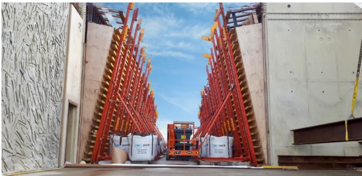
Wanden Station Strand in bekisting

Afgelopen maand zijn een viertal buitenwanden van Station Strand slecht uit de bekisting gekomen. Er is zichtbare schade aan het gestorte beton. Deze buitenwanden zijn deel van de structuur van het station en beïnvloeden daarmee de veiligheid van het hele bouwwerk. Een onafhankelijk bureau is ingeschakeld om de oorzaak te achterhalen, en de constructieve veiligheid te onderzoeken. Mocht blijken dat de veiligheid van een afgebouwd station met deze buitenwanden niet gegarandeerd is, dan is enige vorm van interventie noodzakelijk.